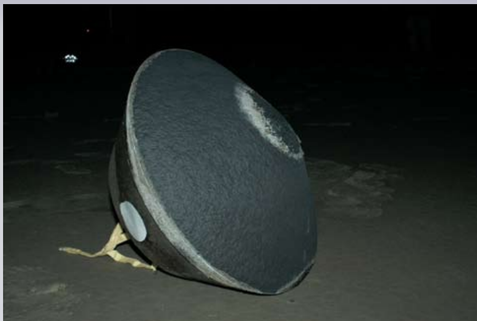
El 15 de enero del 2006 cayó una cápsula en el desierto de Utah. Traía polvo de cometa.

vaciones astronómicas y simulaciones en laboratorios.