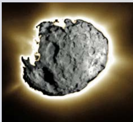
Wild 2 fotografiado por Stardust .

La misión Stardust es la primera sonda automática que nos trae una muestra de material espacial a la Tierra. Ya antes los astronautas habían traído rocas de la Luna, pero una nave no tripulada nunca había logrado esta hazaña. Y éste no es el único