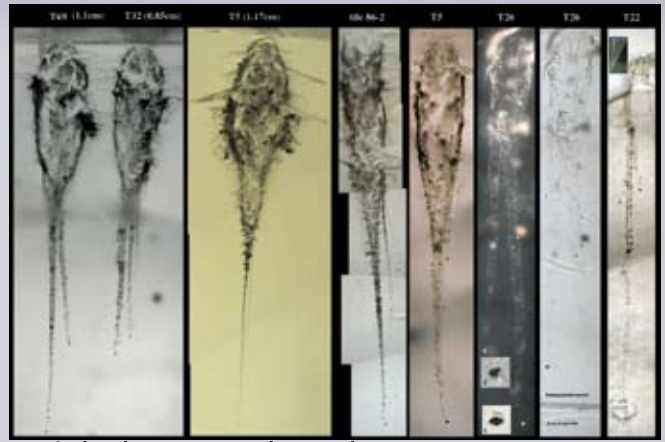
Partículas de cometa en el aerogel.

Una de las partículas recolectadas por el Stardust resultó tan interesante que recibió un nombre propio: Inti, el dios inca del Sol. Inti es un conjunto de fragmentos de roca que está relacionado con unos componentes raros de los meteoritos, llamados inclusiones de calcio ricas en aluminio (CAI, por sus siglas en inglés). El proceso de formación de las CAI requiere muy altas temperaturas, típicas de zonas muy cercanas